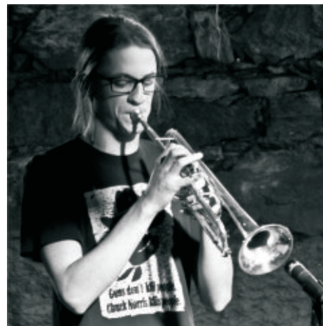
Lenart Zih Koncert jazz oddelka, Satchmo club Maribor