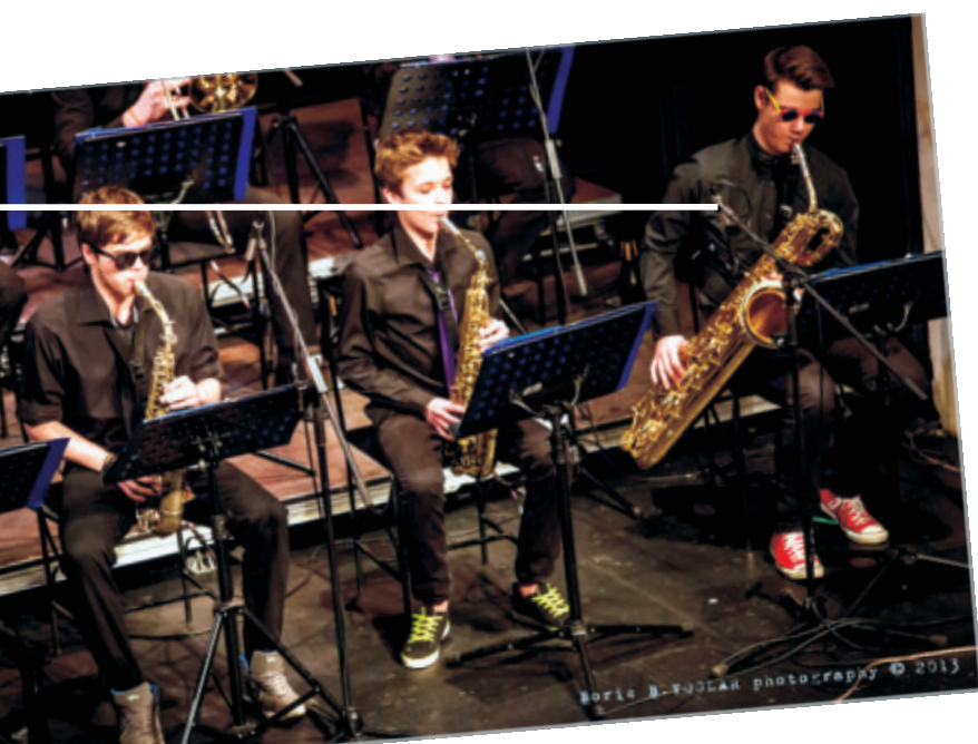
Koncert Big banda ob 20. obletnici delovanja, Stara dvorana SNG Maribor