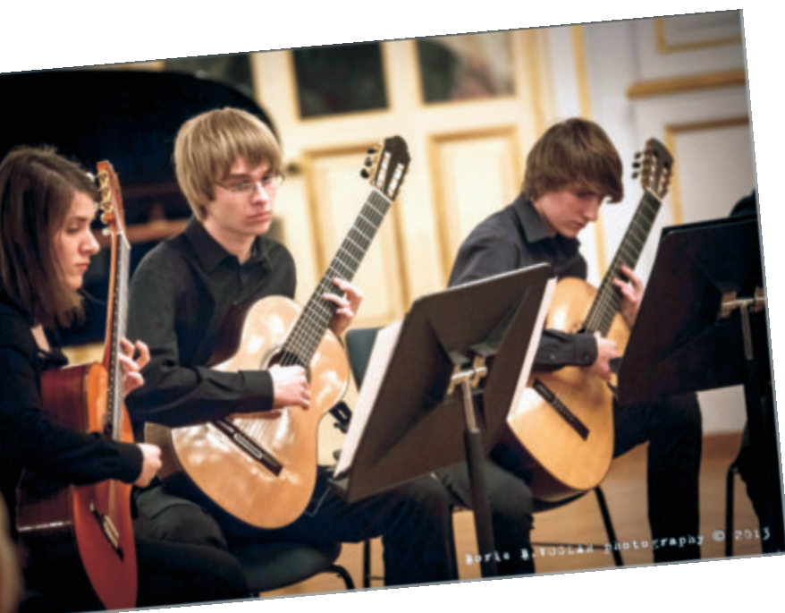
Kitarski orkester umetniške gimnazije, Kazinska dvorana SNG Maribor