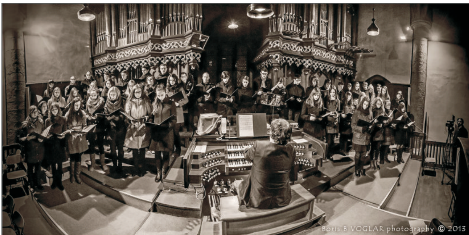
Praznični koncert, zbor umetniške gimnazije, Stolna cerkev Maribor

V okviru umetniške gimnazije delujejo dekliški in fantovski pevski zbor, kitarski ansambel, simfonični, godalni, pihalni, harmonikarski in big band orkester. Vsak od orkestrrov oz. zbor pripravijo na leto vsaj en večji koncert na različnih lokacijah zunaj šole.