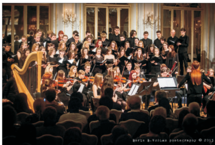
Sedmi koncert komponistov 2013, Kazinska dvorana SNG Maribor