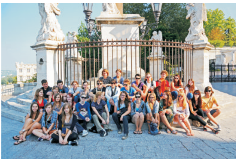
Radi se zabavamo, potujemo, igramo, plešemo in pojemo