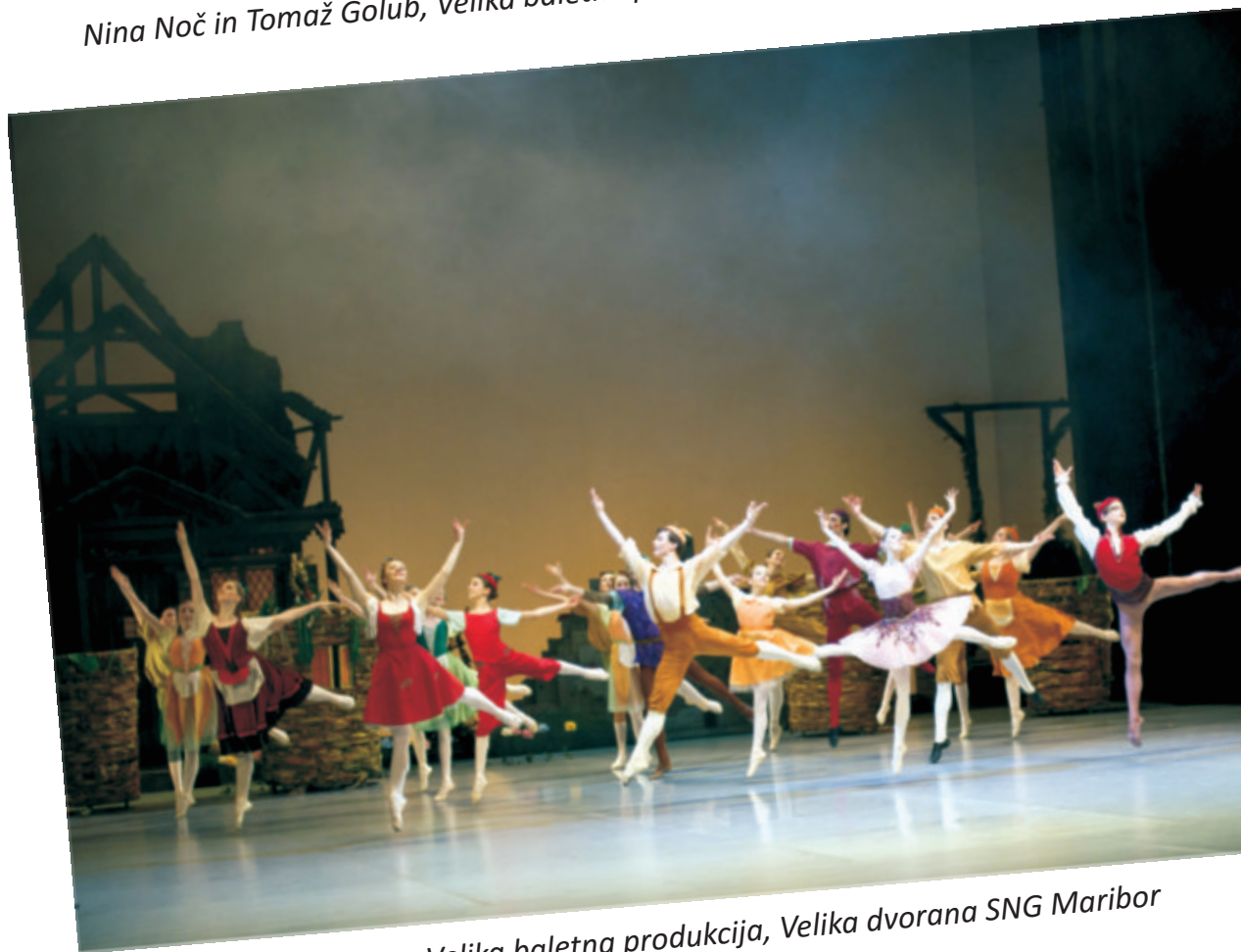
Velika baletna produkcija, Velika dvorana SNG Maribor