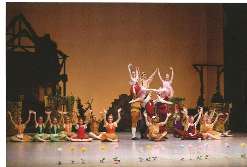
Utrinek iz baleta Cipollino v izvedbi Konservatorija za glasbo in balet Maribor in baletnih plesalcev SNG Maribor