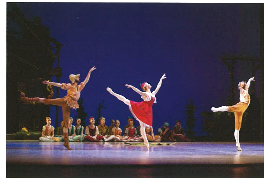
Utrinek iz baleta Cipollino v izvedbi Konservatorija za glasbo in balet Maribor