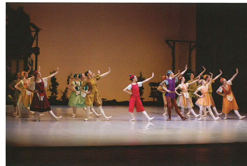
Utrinek iz baleta Cipollino v izvedbi Konservatorija za glasbo in balet Maribor